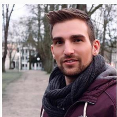
EXAMPLE SPONSORED POST

mar91cus Habe schon des öfteren mal eine Seife davon gehabt. Bin zufrieden damit gewesen 😊 adrian_dallas03 Good🙌 marcelklein24 Hey ..... ich benutze das Deo von Sebamed und durch meine berufliche Stellung arbeite ich mit dem Sortiment von Sebamed. Also ich kümmere mich auch um die Platzierung der Produkte. Liebe Grüße ihr zwei süßen fabls2001 Wow voll schön der Hintergrund!!! said.uill Uff!! Will you kill me? 🍷 ma90re Tolles Pic. Ich kenn die Produkte auch noch nicht. Wer weiss vielleicht bald 🙌 cologne1976 Habe das Duschgel sport, hair und body super angenehm und gut tuend für meine Haut, habe es schön ein halbes