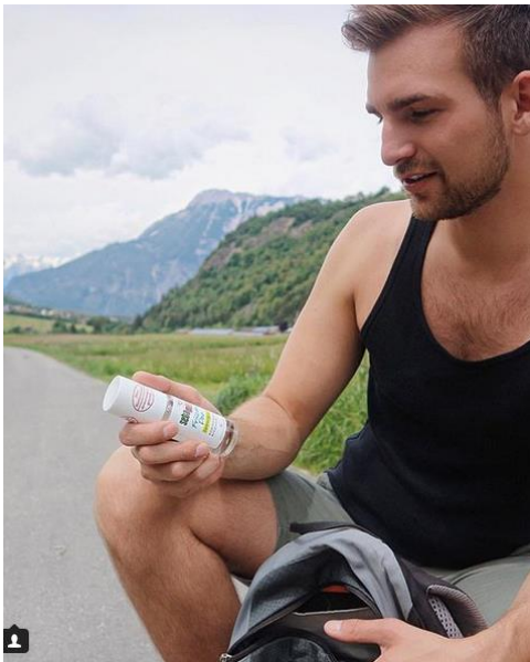
EXAMPLE SPONSORED POST

anna_den91 Hübsch und tolle Uhr 🥰👍 akuspakus Great shot & great watch 🍷 davidrickynainggolan Looks so cool ninalovefashion Klasse Look 🙌🙌🙌👍 amilcarlan Abrazo lindo buen año. marcellsantoz Noch so ein cooler shot. Echt Hammer elezetasf Amazing look ever! Congratulations miladisme The watch is really stylish 😊 👍 nice shot my friend